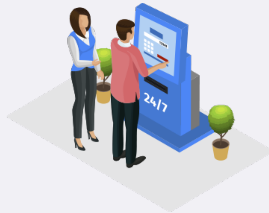
2 - Печать талона