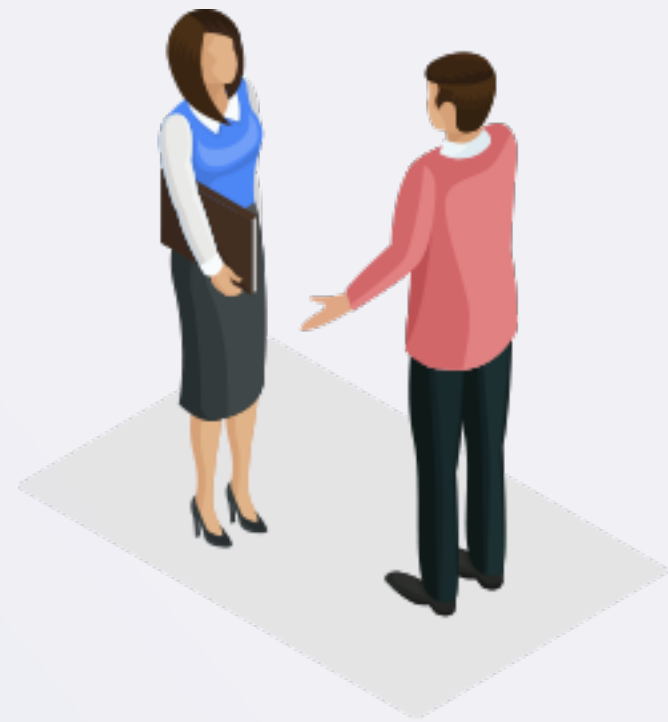
1 - Выбор услуги