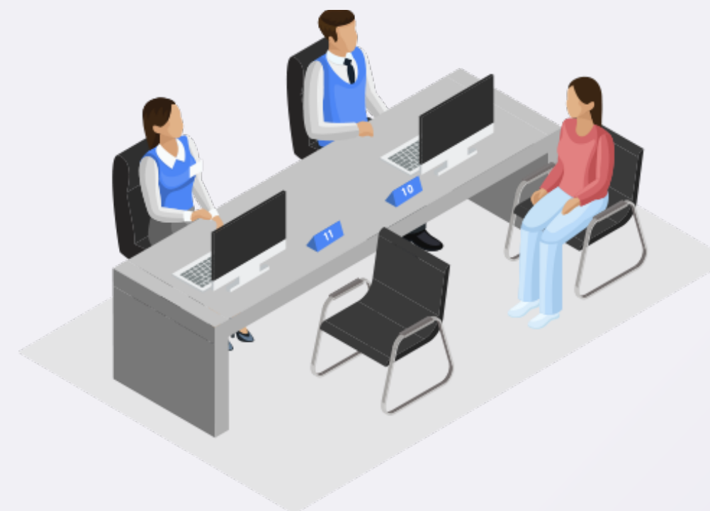
7 - Указание окна оператора