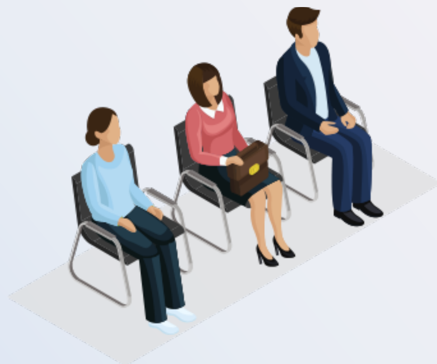
5 - Вызов клиента