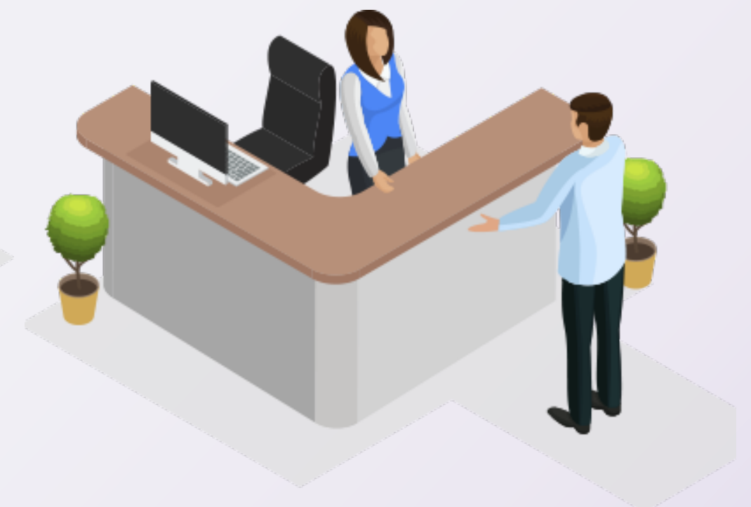
8 - Оценка работы оператора