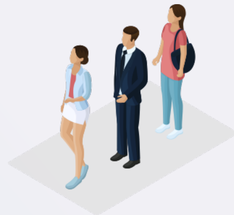
6 - Звуковое оповещение